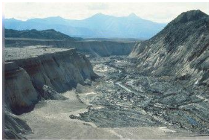
图 2. 此处峡谷系统拥有 100 英尺高的悬崖，在不到一天的时间内就在圣海伦斯火山附近被侵蚀形成！

慢且不易察觉地侵蚀着河道，即使在偶尔的洪水期间也是如此，所以大多数人认为河谷和峡谷的形成一定经历了数百万年的侵蚀。