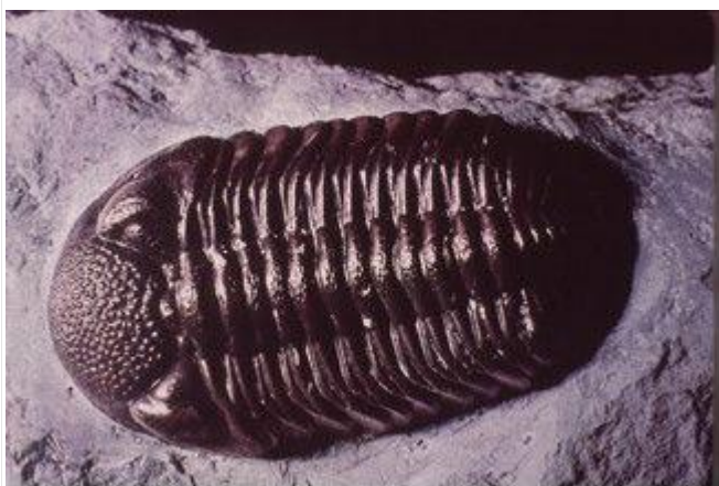
图 1. 一块砂岩中的三叶虫化石

我们观察到一块砂岩是由砂粒胶结而成，并在砂岩内部发现了一块三叶虫化石（图 1）。因此，我们不禁好奇这块三叶虫化石是如何在砂岩中形成的，以及砂岩和三叶虫化石本身又是如何形成的。然而，我们从未亲眼目睹过三叶虫被砂粒掩埋并最终形成化石的过程，也从未亲眼目睹过砂粒的沉积和胶结成砂岩的过程。因此，我们并不真正了解三叶虫化石和砂岩是如何以及何时形成的——仅仅通过观察它们，我们无法确定它们的年代。