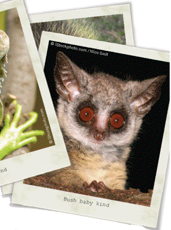
Bush baby kind