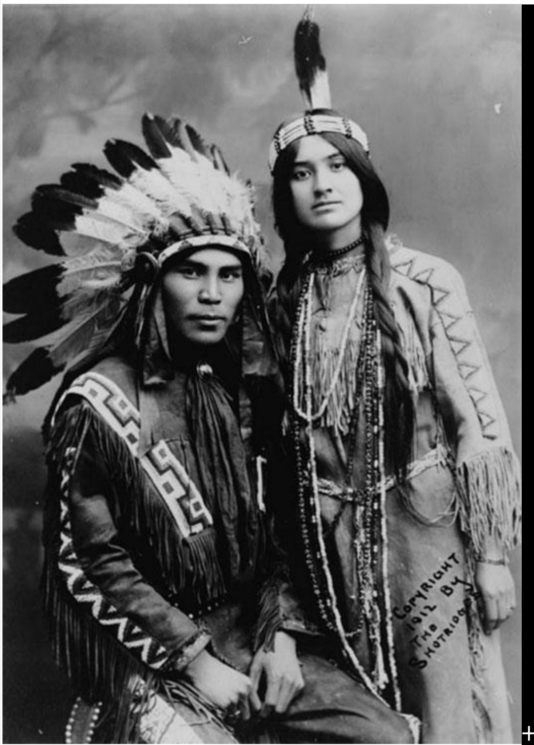
特林吉特夫妇（西图乌卡和卡特夸克斯尼亚），路易斯·肖特里奇绘，1912年

“在我走访过的北美洲、南美洲和中美洲的120个不同部落中，没有一个部落没有向我讲述过类似的灾难传说，其中有一人、三人或