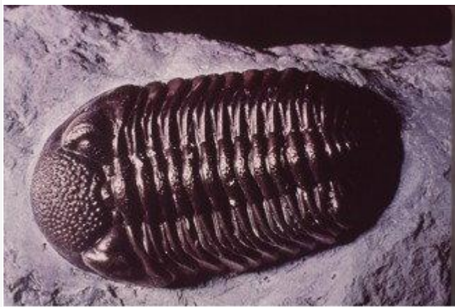
图 1. 一块砂岩中的三叶虫化石

我们观察到一块砂岩是由砂粒胶结而成，并在砂岩内部发现了一块三叶虫化石（图 1）。因此，我们不禁好奇这块三叶虫化石是如何在砂岩中形成的，以及砂岩和三叶虫化石本身又是如何形成的。然而，我们从未亲眼目睹过三叶虫被砂粒掩埋并最终形成化石的过程，也从未亲眼目睹过砂粒的沉积和胶结成砂岩的过程。因此，我们并不真正了解三叶虫化石和砂岩是如何以及何时形成的——仅仅通过观察它们，我们无法确定它们的年代。