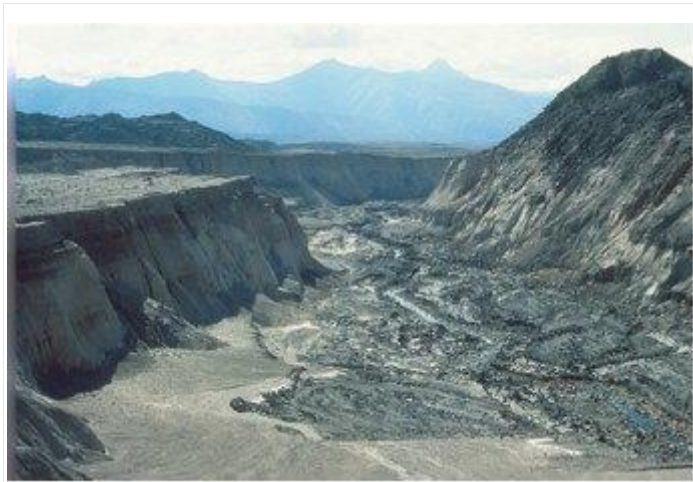
图 2. 此处峡谷系统拥有 100 英尺高的悬崖，在不到一天的时间内就在圣海伦斯火山附近被侵蚀形成！

慢且不易察觉地侵蚀着河道，即使在偶尔的洪水期间也是如此，所以大多数人认为河谷和峡谷的形成一定经历了数百万年的侵蚀。