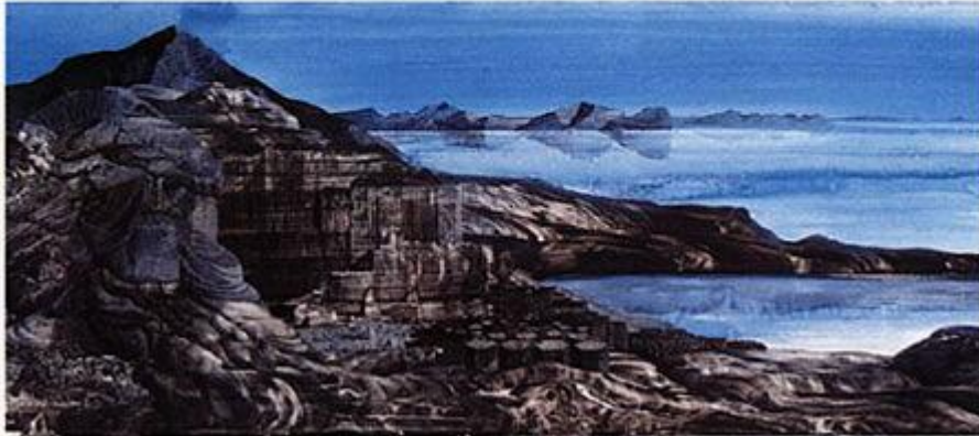
46 An early ocean 3800 million years ago