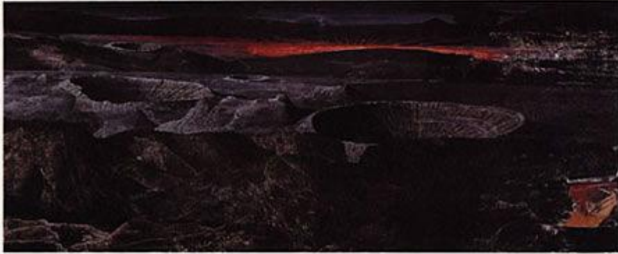
45 Solid crust with meteorite craters 4000 million years ago