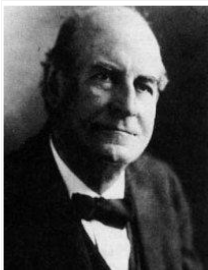
威廉·詹宁斯·布莱恩

布莱恩曾担任民主党领袖长达 25 年，并三次竞选美国总统均告失败。尽管他被认为是一位保守的基督教徒，但他的政治观点在当时却非常自由派；事实上，就连极右翼的自由主义者克拉伦斯·达罗也曾在他前两次竞选总统时支持他。布莱恩曾在伍德罗·威尔逊总统任内担任国务卿。