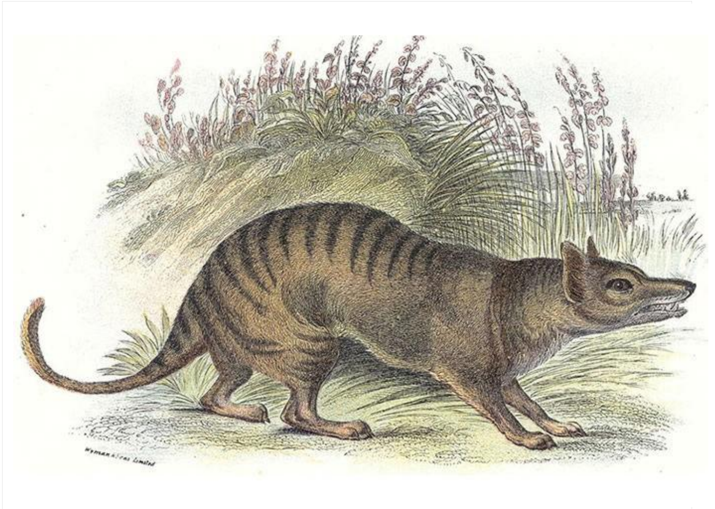
袋狼。图片由 William Home Lizars 提供，来自 Wikimedia Commons 。