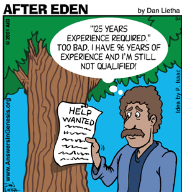
Job hunting in the days before Noah's flood.

积累许多突变，持续分裂可能导致癌症等疾病。大多数体细胞无法无限复制，最终 导致 衰老和死亡。因此，端粒对于决定直接影响衰老的细胞类型的寿命至关重要。