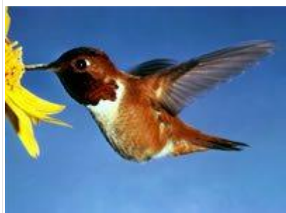
图 7. 红喉蜂鸟 21

西哥和中美洲的马德雷斯山脉；秘鲁的安第斯山脉），蜂鸟授粉的植物种类却急剧增加。中美洲和安第斯山脉地区拥有地球上最高的蜂鸟多样性并非偶然，因为大多数重要的蜜源植物都生长在这里。表 1 列出了美国西部繁殖的蜂鸟及其蜜源植物伙伴。