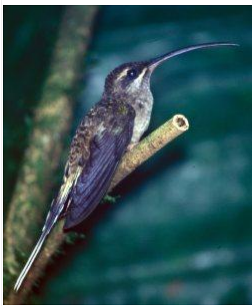
图 6 . 厄瓜多尔男爵隐士 ( Phaethornis longirostris ) 18

后，再将其转移到下一朵花上。蜂鸟的生理构造使其能够从管状花朵中吸取花蜜。喙的结构影响着不同种类蜂鸟所选择的花朵类型。长喙适合插入较长的花管中，而短喙蜂鸟则访问短管花朵。这些不同的共生关系使得长嘴和短嘴传粉昆虫能够共存，竞争降至最低。喙的形状也可以分为直喙和向下弯曲（下弯，图 6）。喙的弯曲程度通常与笔直或弯曲度较大的花管相对应。蜂鸟的舌头也是一个独特的构造。舌头两侧有沟槽，可以收集花蜜。