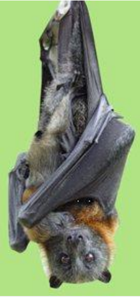
图 3. 灰头狐蝠及其幼崽 9

在美国，仅有三种以花蜜为食的长舌蝠（ 雪地长舌蝠 、 库拉索长舌蝠 和 墨西哥长舌蝠 ，图 2）分布于其分布范围的北缘。亚利桑那州栖息着两种以花蜜为食的蝙蝠（ 库拉索长舌蝠 和 墨西哥长舌蝠 ），它们对柱状仙人掌（巨人柱和管状仙人掌）以及龙舌兰属沙漠植物的授粉至关重要。如果没有这些以花蜜为食的蝙蝠，龙舌兰和各种仙人掌的授粉率将下降约 97%。小长鼻蝠（ 库拉索长舌蝠 ）是专食性动物，以仙人掌（管状仙人掌、卡顿仙人掌和巨人柱）和龙舌兰花（ 帕尔默龙舌兰 ）为食。小长鼻蝠通过为仙人掌授粉和传播种子，确保沙漠生态系统的健康，并使仙人掌种群得以延续。 大长鼻蝠 （ Leptonycteris nivalis ）会根据龙舌兰的夏季花期，调整其从墨西哥迁徙到德克萨斯州