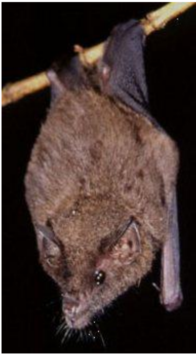
图 1. 杰弗里无尾蝙蝠 4