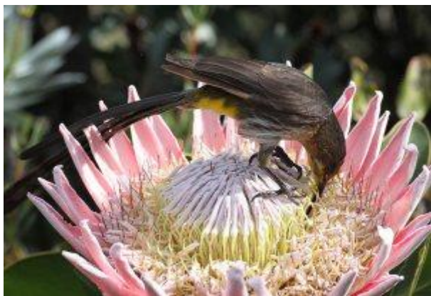
图 10. 南非甜鸟栖息于帝王花 ( Protea cynaroides ) 上 28

( Nectarinia famosa ) 是该类群中体型最大的，它们自然会造访芦荟、帝王花、烛台花 ( Brunsvigia orientalis ) 和野芝麻 ( Leonotis 属) 等大型红色花朵。 27