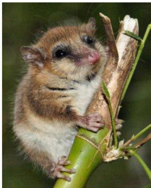
图 14 . 蒙特莫尼托 36

英寸的小型哺乳动物。然而，它与蜜袋鼯并非近亲，而且是少数真正以花蜜为食的哺乳动物之一。蜜袋鼯长而尖的吻部和长而可伸缩、舌尖呈刷状的舌头，使其能够采集澳大利亚本土植物班克木属（ Banksia ）和腺花属（ Adenanthos ）的花粉和花蜜。