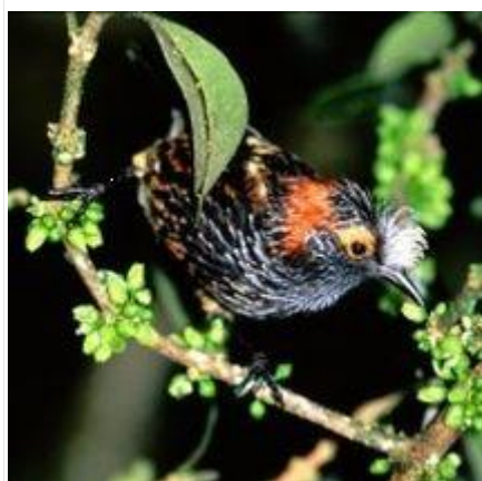
图 8. 凤头吸蜜鸟 24