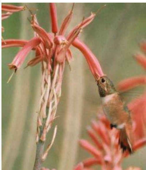
图 5. 艾伦蜂鸟的额头沾满了花粉 16

蜜蜂利用气味寻找花朵，携带的花粉量比蜂鸟多，而且往往将大部分花粉落在最先访问的几朵花上。蜂鸟则利用视觉寻找花朵，它们将花粉均匀地散布在花朵群中，并且由于新陈代谢率更高，它们摄入的花蜜也比蜜蜂多。因此，由蜂鸟授粉的植物通常香味较淡或没有香味，但产生的花蜜量却比由蜜蜂授粉的植物更多。试想一下，如果你是一位花卉设计师，你会如何设计花朵来吸引传粉昆虫呢？