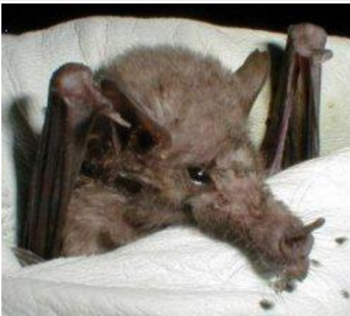
图 2. 墨西哥长舌蝠 5

管唇蜜蝠 ( Anoura fistulata ) 于 2005 年在厄瓜多尔安第斯山脉的森林中被发现。研究人员报告称，这种蜜蝠的舌头可以伸出自身体长的 1.5 倍，比任何其他哺乳动物都长，在脊椎动物中仅次于变色龙。此外，这种蝙蝠的舌头伸出的长度是其同属其他成员的两倍。这种蝙蝠进化出更长的舌头是为了吸食一种管状花