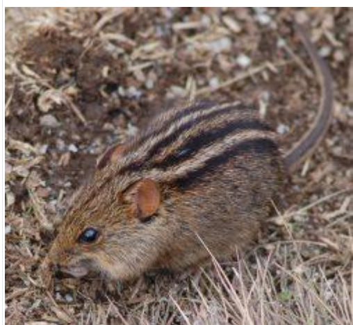
图 15. 条纹小鼠 40

在南非，至少有四种啮齿动物会在夜间造访马索尼亚百合（ Massonia depressa ）的花朵：两种沙鼠，分别是毛足沙鼠（ Gerbillurus paeba ）和开普短耳沙鼠（ Desmodillus auricularis ）；以及两种鼠科动物，分别是纳马夸岩鼠（ Aethomys namaquensis ）和开普刺鼠（ Acomys subspinosus ）。这种百合花生长在地面附近，颜色并不鲜艳。花蜜是从一个结构精巧的碗状开放式花腔中采集的。夜间，人们在单个马索尼亚百合花中发现了大量的花蜜。 39