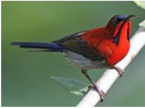
图 9. 绯红太阳鸟 25

夏威夷吸蜜鸟从通常硕大、色彩艳丽且呈红色的花朵中吸取花蜜并为其授粉。这些花朵的花冠呈独特的扭曲状，正好适合吸蜜鸟弯曲的喙。由凤头吸蜜鸟（ Palmeria dolei ）（图 8）授粉的植物包括：奥希亚莱胡阿（Ohi'a lehua，学名： Metrosideros polymorpha ）、许多本地木槿属植物以及本地山梗菜属植物（例如： Trematolobelia macrostachys ）。 <sup>26</sup>