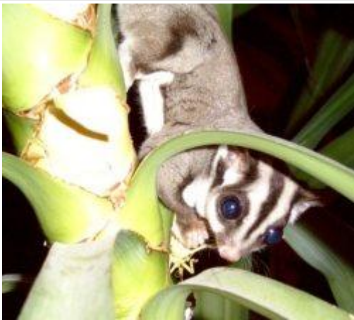
图 13. 蜜袋鼯 35

红腹狐猴（学名： Eulemur rubriventer ，图 12）是马达加斯加特有的灵长类动物。红腹狐猴主要以水果为食，但也吃树叶、花蜜和花朵。它们会舔舐花朵中的花蜜，而不会伤害花朵。红腹狐猴会造访旅人蕉（学名： Ravenala madagascariensis ），并可能为其授粉，也可能造访布雷西亚树（ Brexia ）和帕基亚树（ Parkia ）等植物。