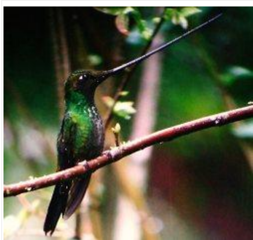
图 4. 剑嘴蜂鸟 12

蜂鸟在众多灌木和藤本植物的授粉过程中扮演着重要角色，其中一些植物专门适应蜂鸟授粉。据估计，整