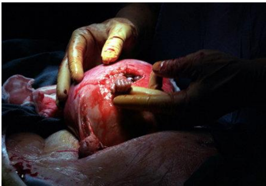
图 2： 怀孕 21 周时，塞缪尔·阿玛斯伸出手抓住了外科医生的手指。我们的语言能力和其他基本人类活动能力早在出生前就已经开始发展。

三岁半时，塞缪尔和父母以及克兰西一起去国会作证。堪萨斯州参议员萨姆·布朗巴克问塞缪尔是否认识那个婴儿，塞缪尔回答说：“塞缪尔。”布朗巴克又问他是否知道发生了什么事，塞缪尔说他们在帮他处理“伤口”。 11